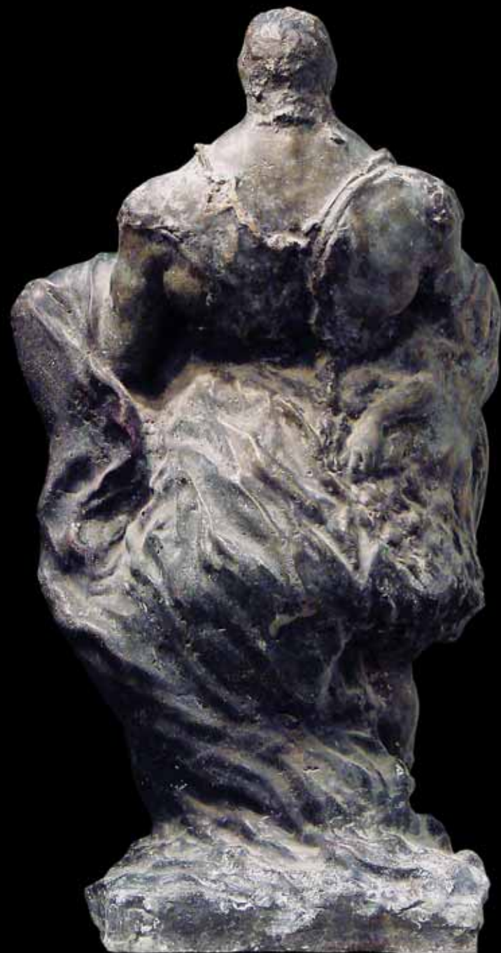
Ursus (Quo vadis), oko 1927. – 1932.