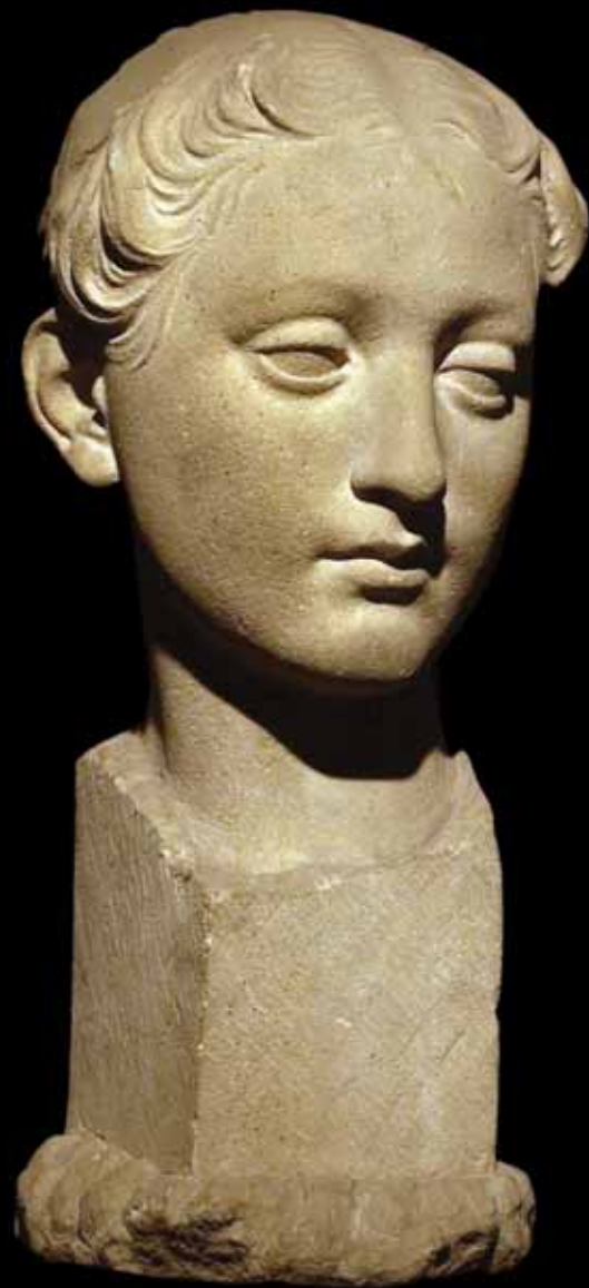
Glava kćerke, 1936.