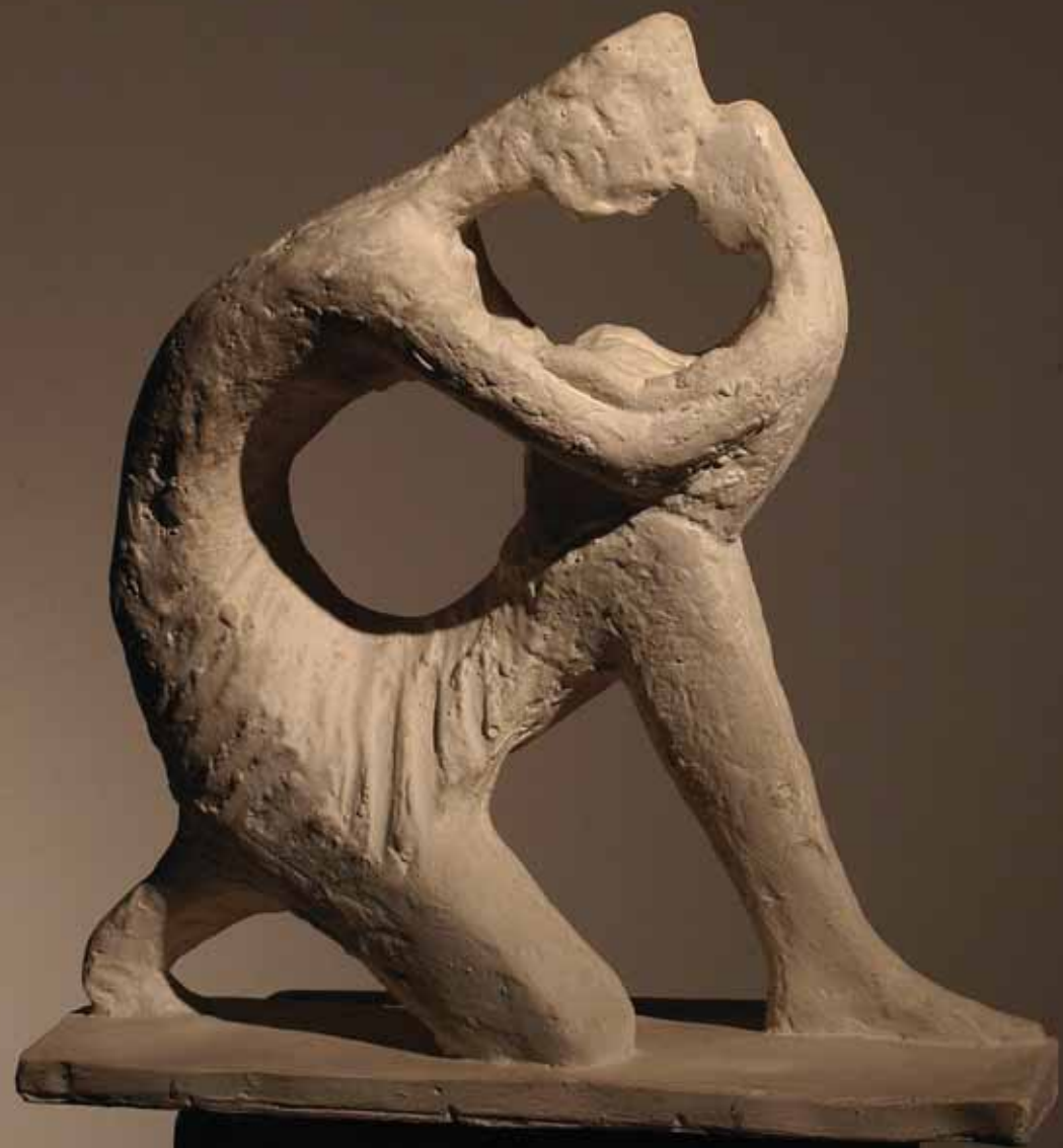
Majka i dijete