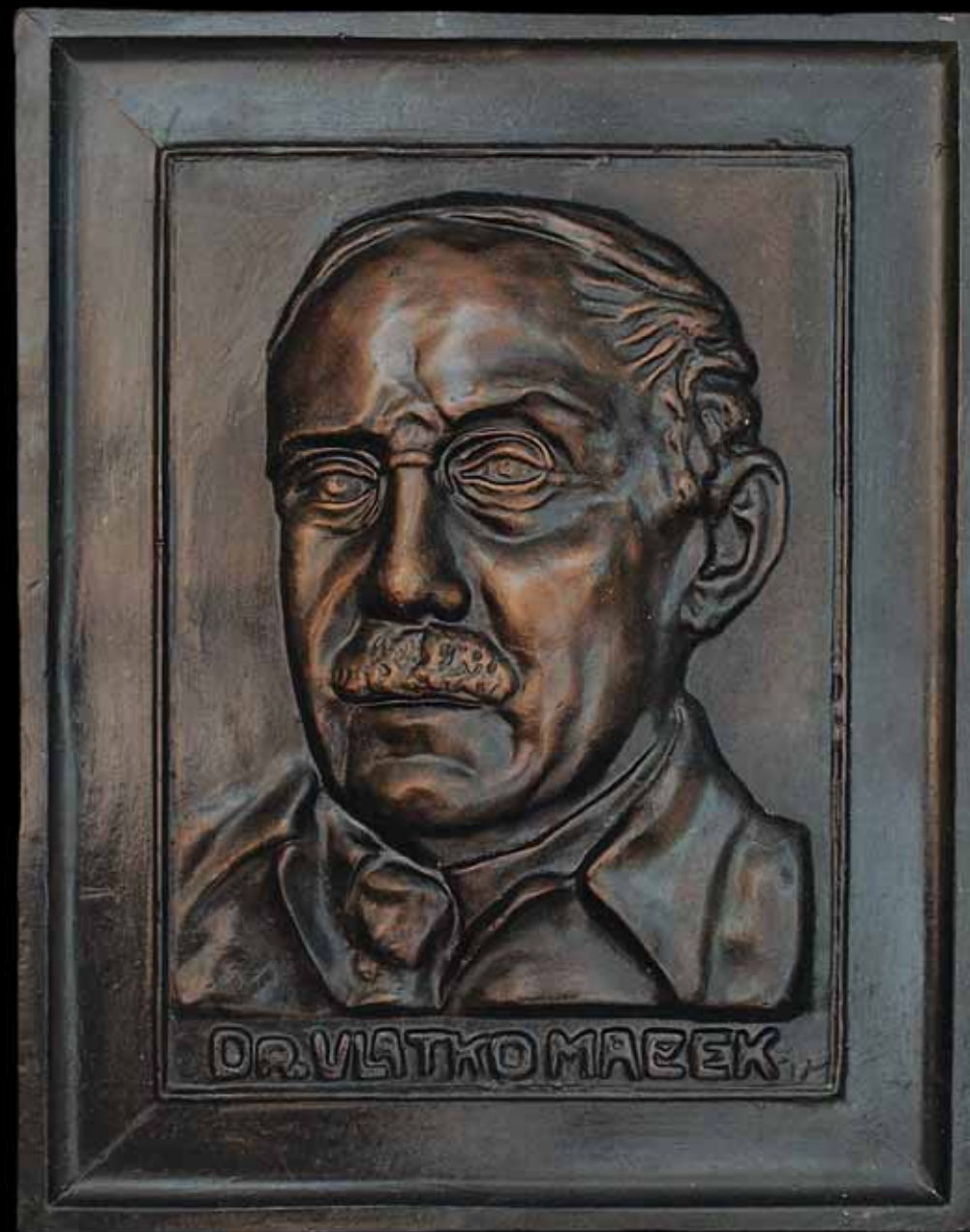
Vladko Maček, plaketa