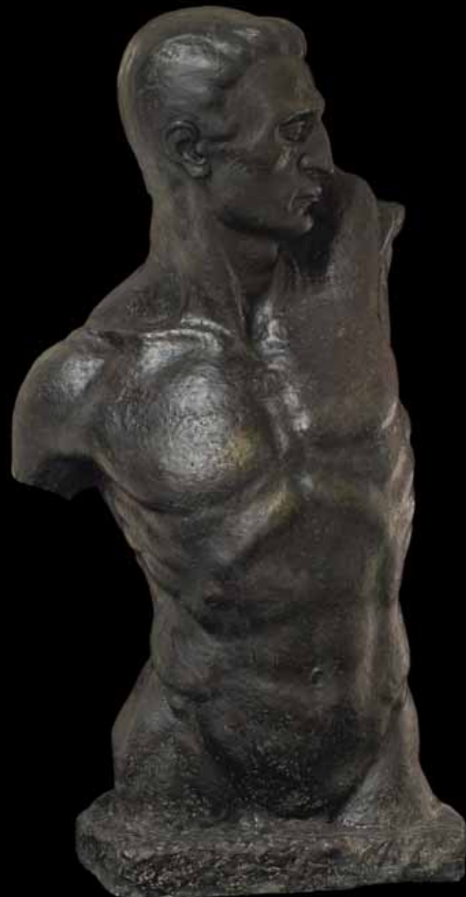
Muški torzo, studija