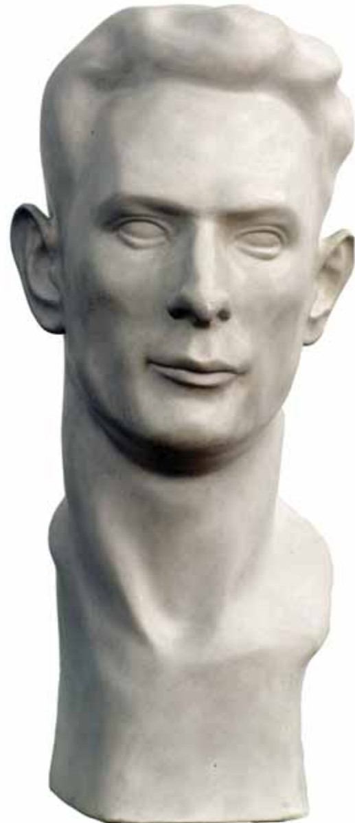
Glava mladića, 1925.