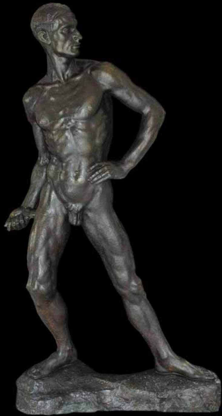
Studija muškog akta, oko 1928. – 1930.