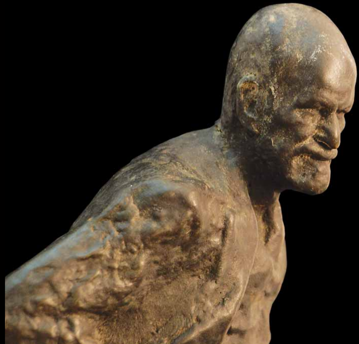
Portret Sigmunda Freuda, oko 1931.