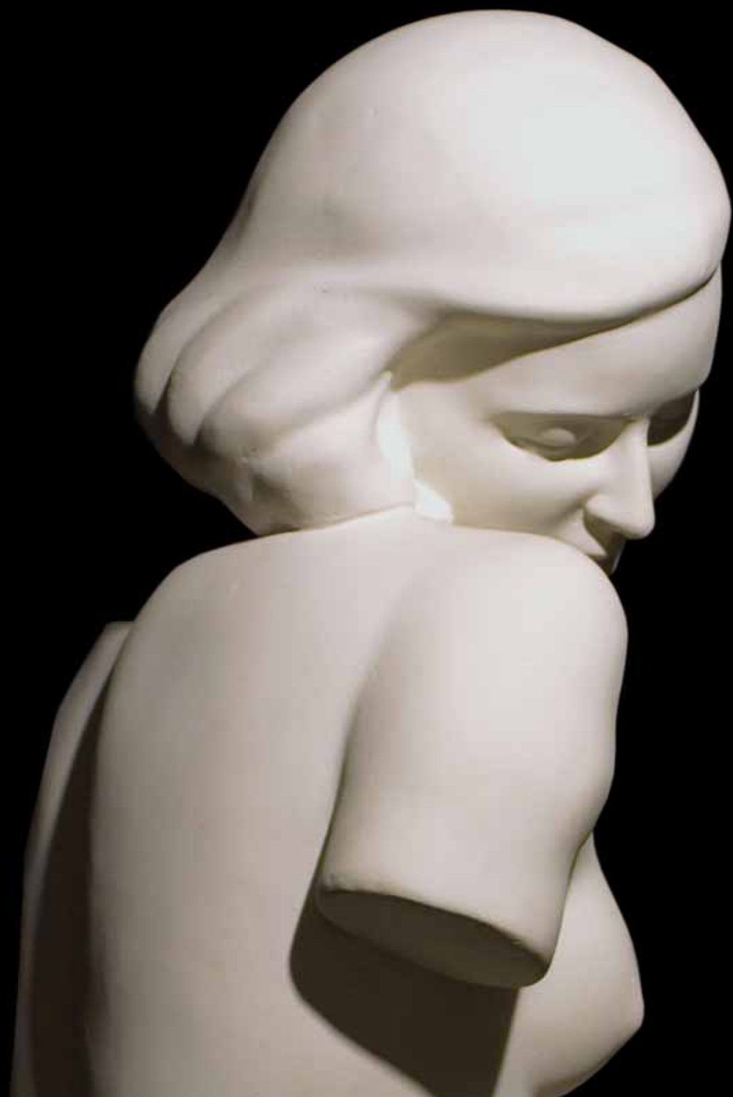
Ženski akt, 1938.