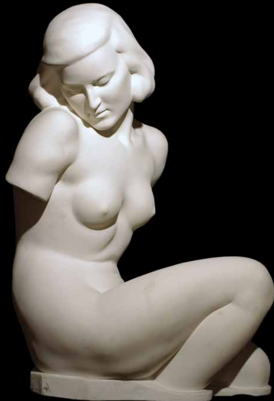
Ženski akt, 1938.