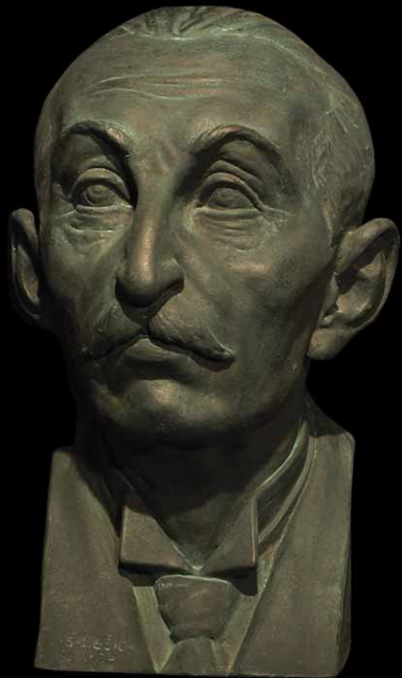
Josip Kozarac, 1938.