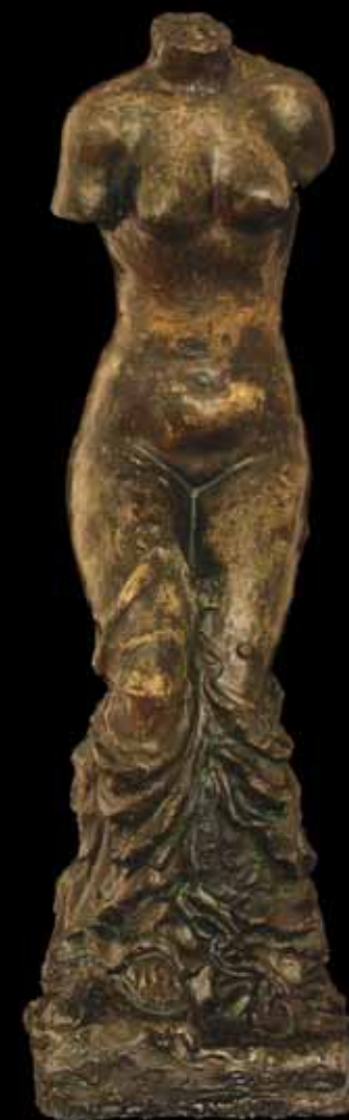
Ženski torzo, oko 1927.