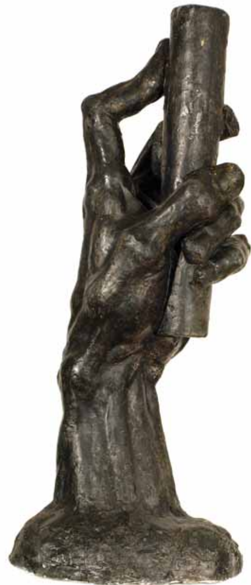
Studija ruke, 1929.