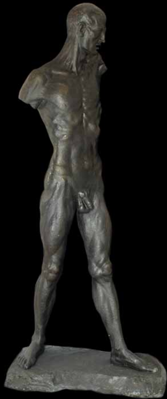
Muški akt, studija, 1928.