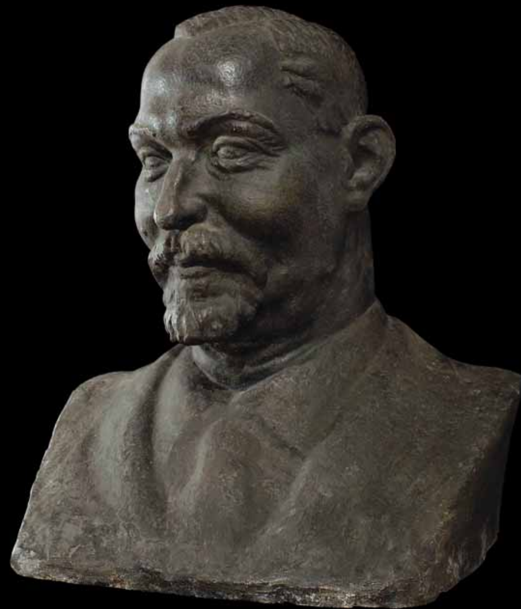
Portret Stjepana Radića, 1928.